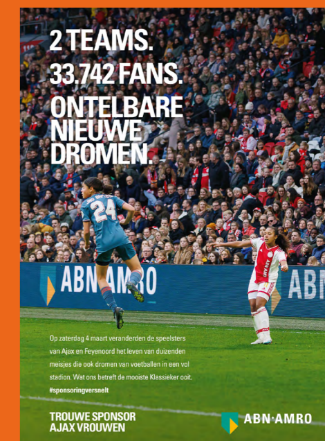
Op zaterdag 4 maart veranderden de speelsters van Ajax en Feyenoord het leven van duizenden meisjes die ook dromen van voetballen in een vol stadion. Wat ons betreft de mooiste Klassieker ooit. #sponsoringverselt

“Veel partijen onderschatten wat de kracht van een sponsor zou kunnen zijn en dat je als sponsor dingen in stand houdt, zonder dat je je daar als sponsor bewust van bent. Sponsoring kan een uniek middel zijn om maatschappelijke thema's aan te pakken. Met ons sponsorgeld willen we dat vrouwenvoetbal een vlucht gaat nemen.”