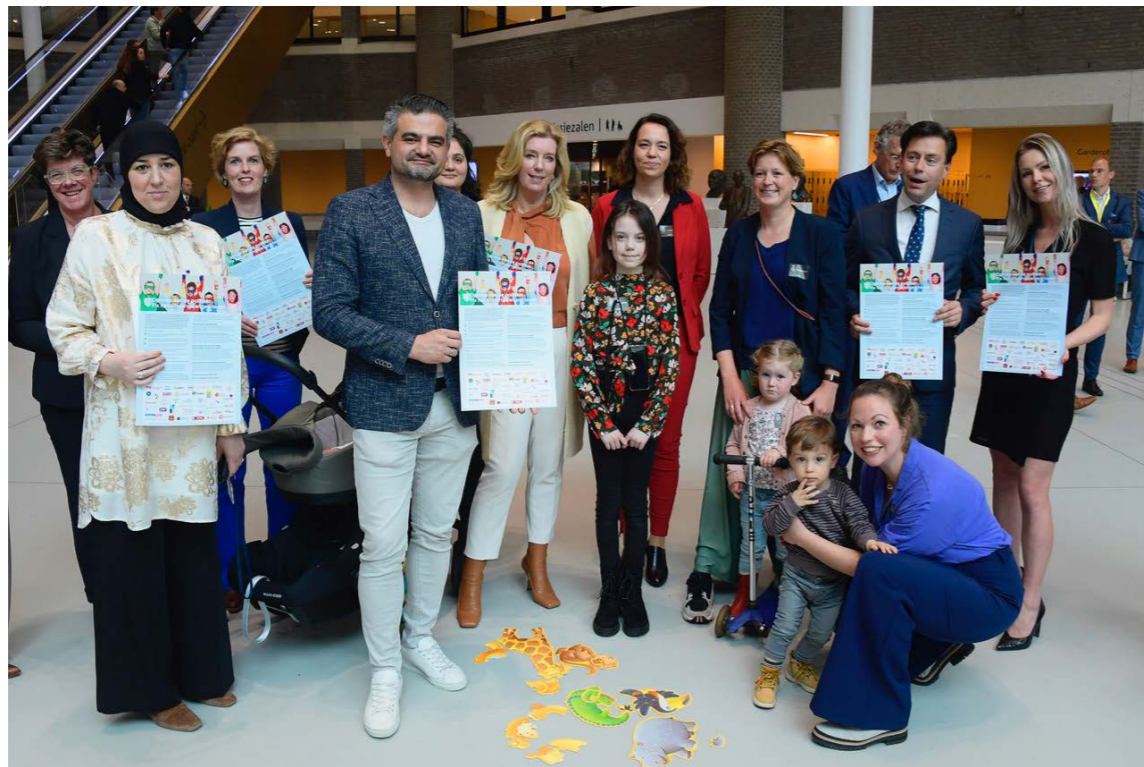
AANGEBODEN MANIFEST 'FIX HET KINDEROPVANGSYSTEEM'